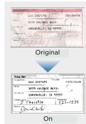
Utilisation du mode de seuil actif

Grâce à ses puissantes fonctions de traitement de l'image, le DR-S130 offre toujours des résultats de haute qualité. Les fonctions telles que la détection automatique des couleurs, la reconnaissance de l'orientation du texte, la détection automatique du format de papier et le redressement vous font gagner du temps. Grâce au mode de seuil actif, il est possible de numériser et de traiter simultanément plusieurs pages d'un document, qu'ils comprennent du texte pâle ou des fonds à motifs, sans avoir à modifier les paramètres, faisant ainsi gagner un temps précieux.